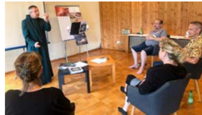
Seminar in Lichtenstein

Es gab keine bessere Zeit, genau jetzt die Weichen für diese neue Aufgabe zu stellen. Über ein Onlineseminar fing ich an, mich auf diese spannende Geschichte vorzubereiten. Seminare müssen kommen, bei denen der Himmel aufgeht und Menschen ihre Wertschätzung in Gott entdecken.