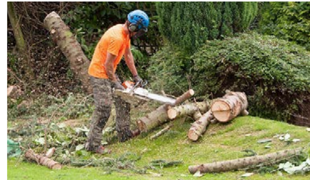
>>> aus den Aufgabengebieten

Der erste Samstag wurde geplant, und ein Team vom Winterlinger CVJM fand sich am frühen Morgen bei uns ein. Mit Fachkenntnis konnten wir viele Fällarbeiten im Garten erledigen. Unzählige hoch aufgepackte Anhänger