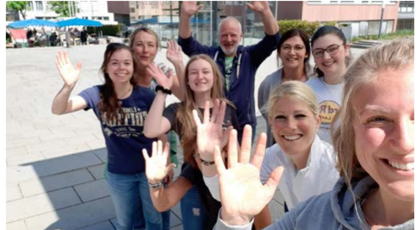
Das Gerlinger Markt-Team