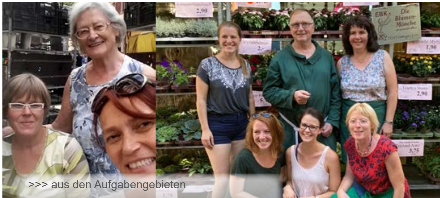
>>> aus den Aufgabengebieten