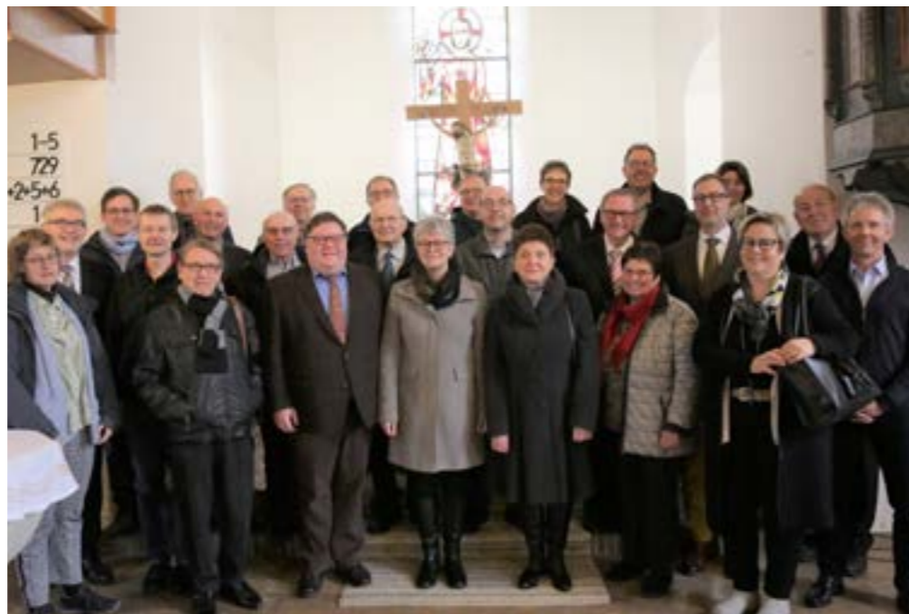
Prädikanten in Mehrstetten

Dieses Jahr erfolgte die Einladung zum Prädikantentreffen des Kirchenbezirks Bad Urach-Münsingen nach Mehrstetten auf der Schwäbischen Alb zum Gottesdienst in die renovierte Georgskirche. Danach ging es zum Austausch in den Landgasthof. Dort wurde zuerst der Gottesdienst besprochen. Die anschließende Inforunde brachte zutage, dass im vergangenen Jahr knapp 400 Gottesdienste von 28 Prädikantinnen und Prädikanten im Bezirk gehalten wurden.