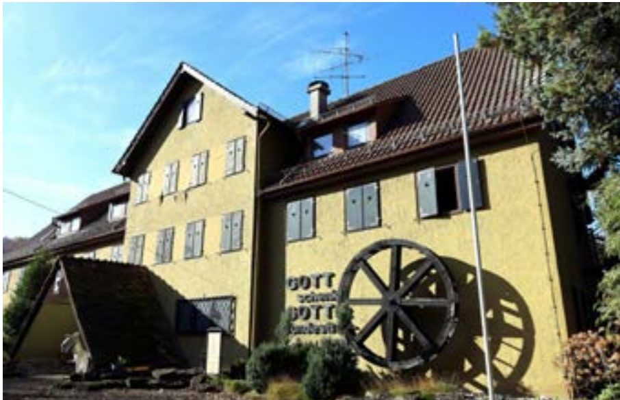
Die Blumenmühle braucht eine Generalsanierung